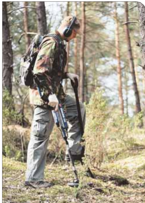
Oczyszczanie lasu w pobliżu Dąbkowizny z niewybuchów i niewybuchów z okresu II wojny światowej

W akcji oczyszczania kompleksu leśnego uczestniczyli również pracownicy Urzędu Gminy Nieporęt. Dział Bezpieczeństwa, Zarządzania Kryzysowego i Obrony Cywilnej UG zabez-