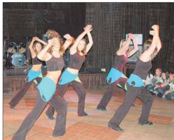
Występ zespołu Batocado 5 z Filii Gminnego Ośrodka Kultury w Stanisławowie Drugim