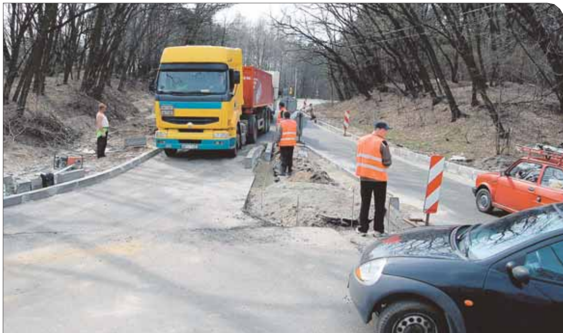
Kierowcy przejeżdżający przez Józefów drogą nr 632 (ul. Strużańska) przez kilka tygodni natrafiali na spore utrudnienia w ruchu.