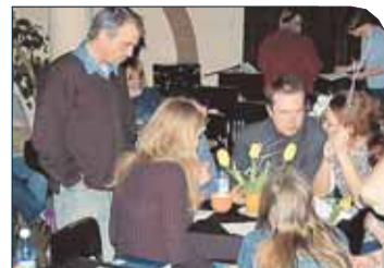
Komisja konkursowa Turnieju Jednego Wiersza w trakcie obrad