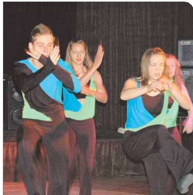
Zespół Batocado 5 z Filii Gminnego Ośrodka Kultury w Stanisławowie Drugim – I miejsce w kategorii powyżej 15 lat