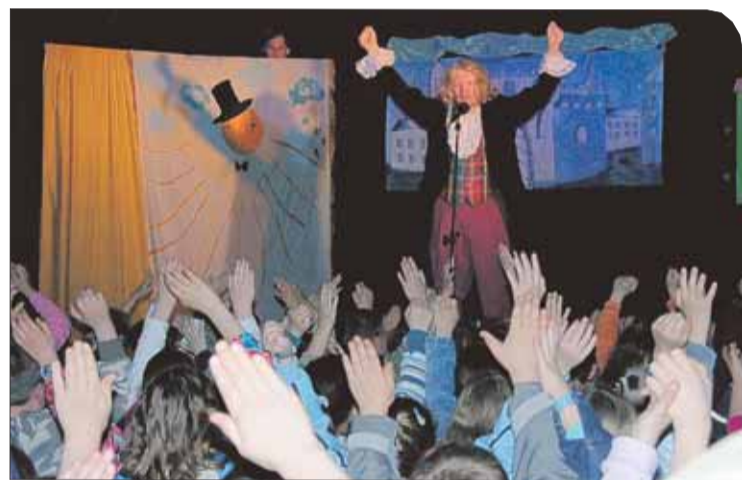
Dzieci z zapalem pomagaly Niteczce zaszyć dziurę w niebie.