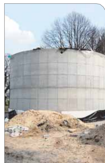
Zbiornik wody czystej

pokryje Unia Europejska ze środków Zintegrowanego Programu Operacyjnego Rozwoju Regionalnego.