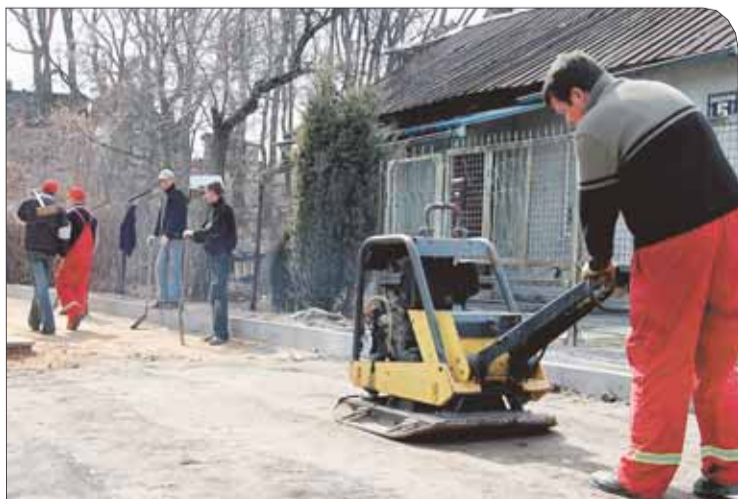
W Zegrzu zakończyła się już budowa ulicy Świerkowej