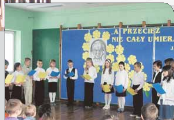
Uczniowie Zespołu Szkolno-Przedszkolnego w Nieporęcie wspominają Papieża Jana Pawła II

ciele śpiewali ją ze łzami w oczach. Po niejedynej twarzy łzy popłynęły także w czasie piosenki „Lolek”, skomponowanej już po śmierci papieża.