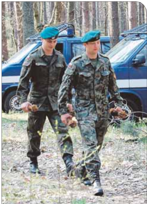
W trakcie akcji zebrano łącznie 60 kg czystego trotylu

Akcję usuwania niewybuchów prowadzili policjanci z Wydziału Terroru Kryminalnego i Zabójstw Komendy Stołecznej Policji wraz z cywilami, zawodowo zajmującymi się tego typu poszukiwaniami. Teren kompleksu leśnego zabezpieczali policjanci z wydziału prewencji Komendy Stołecznej. W akcję zaangażowani byli również funkcjonariusze Straży Gminnej, Straży Leśnej, Żandarmerii Wojskowej oraz strażacy OSP.