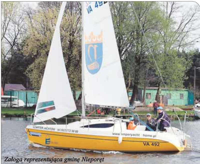
Załoga reprezentująca gminę Nieporęt

30 kwietnia w Porcie Emper Yacht nad Zalewem Zegrzyńskim zainaugurowany został sezon żeglarski 2006. Przez dwa dni żeglarze sprawdzali swoje umiejętności po długiej zimowej przerwie.