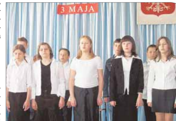
Uczniowie klasy V SP w Białobrzegach w programie artystycznym z okazji Święta 3 Maja