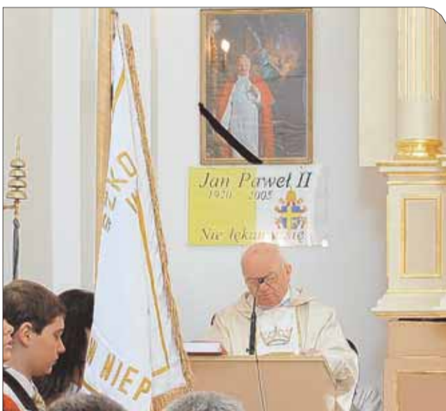
Uroczystości rozpoczęła msza św. w intencji Ojczyzny