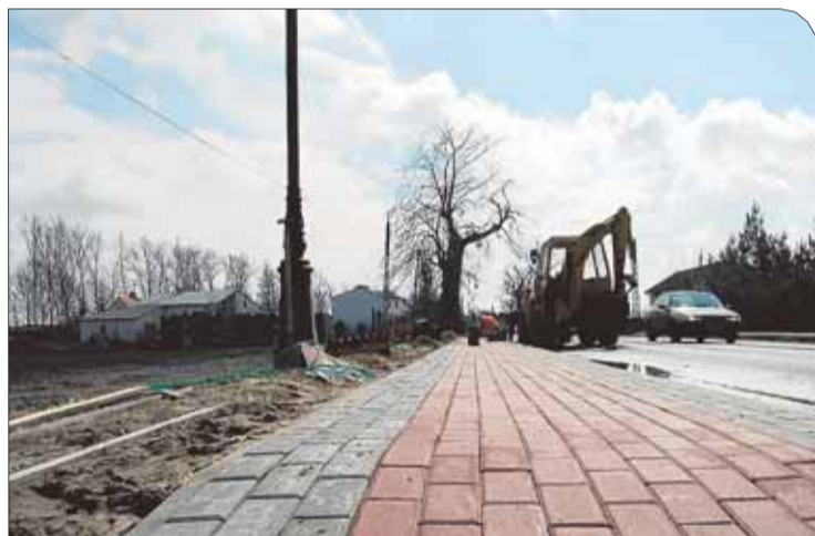
W Nieporęcie roboty objęły budowę 300 metrów bieżących chodnika wraz z krawężnikami.

Zakończono również budowę chodnika (ok. 400 m) w Beniaminowie przy drodze powiatowej z Białobrzegów. Robotnicy zerwali stare, popękane płytki. W ich miejsce ułożono estetyczną kostkę bauma. Prace (obejmujące również ułożenie krawężnika) wykonała stołeczna firma Dowbud. Kontrakt opiewał na kwotę blisko 97 tys. zł. To już trzeci etap prac. W latach poprzednich zbu-