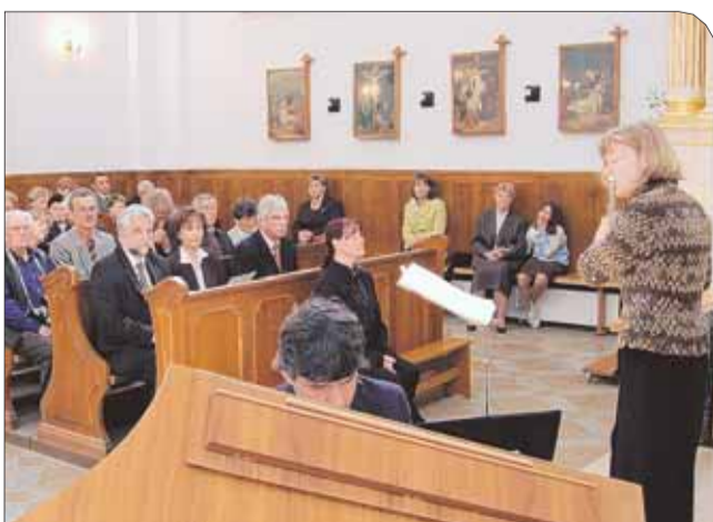
Koncert muzyki poważnej w Kościele parafialnym w Nieporęcie

Gminne uroczystości z okazji 215. rocznicy uchwalenia Konstytucji 3 Maja zorganizowane zostały w dniu święta narodowego i religijnego. Złożyły się na nie uroczysta msza św. i koncert w kościele parafialnym w Nieporęcie