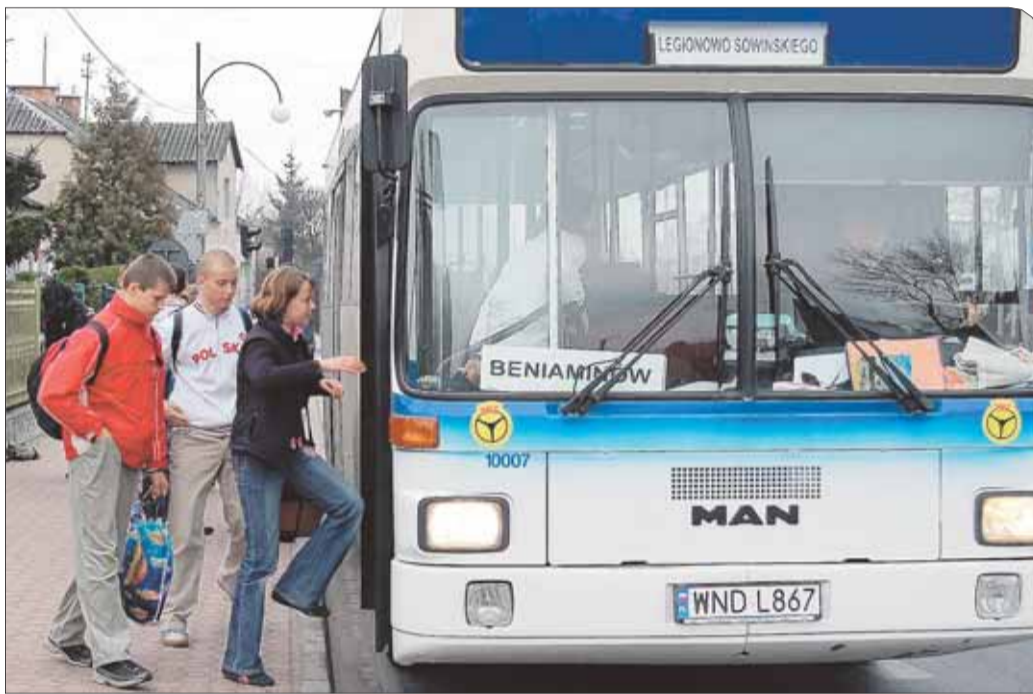
Autobus PPKS Nowy Dwór Mazowiecki