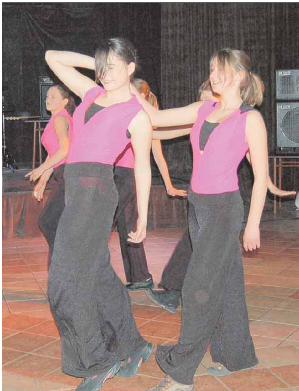
Występ zespołu Batocado 4 z Filii Gminnego Ośrodka Kultury w Kątach Węgarskich