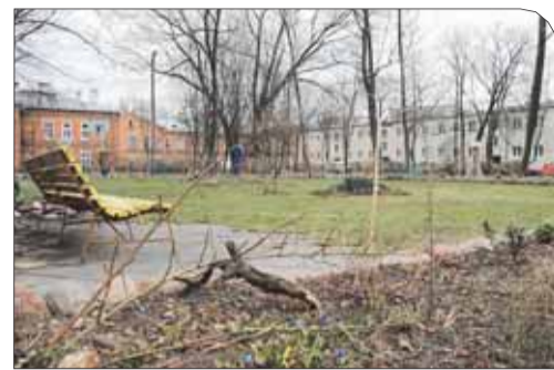
Decyzję w sprawie zagospodarowania gruntów mają podjąć sami mieszkańcy

szące. Widać jednak inicjatywę mieszkańców, którzy skromnymi