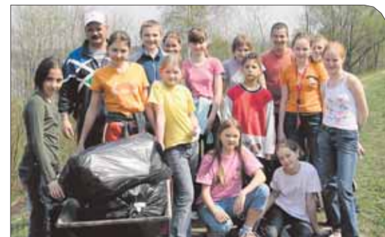
Uczniowie klasy VI, którzy sprząkali nabrzeże Zalewu Zegrzyńskiego

Patronem akcji było Koło Wędkarskie w Biało-brzegach. Członkowie koła przygotowali dla uczniów miłą niespodziankę w postaci poczęstunku: grill z kiełbaskami, napoje i coś słodkiego na deser. Po męczącej pracy dzieci chętnie odpoczęły, a dziękując wędkarzom urządziły krótki koncert piosenek.