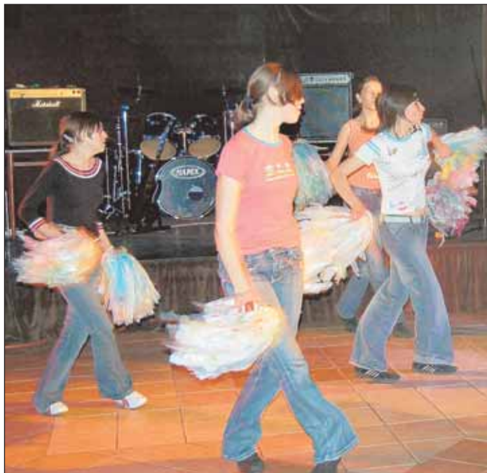
Występ cheerleaderek z Gminnego Ośrodka Kultury w Nieporęcie