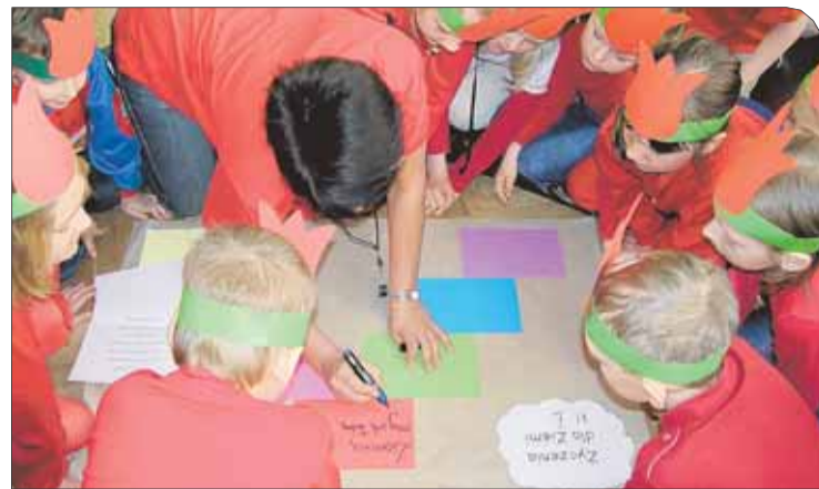
Uczniowie układają życzenia dla Ziemi

Pomysł zorganizowania pierwszego Ekoturnieju zrodził się w 2002 roku, a jubileuszowy piąty Ekoturniej był okazją do wspo-